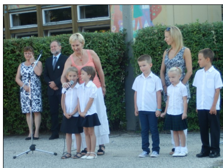
Évnyitó 2015. szeptember 1.

nyal még sokáig fennmaradó formáját megtartani. Fogadjátok/fogadják szeretettel azokat a sorokat, melyeket lelkes gyerekek, nevelők írnak, bízva abban, hogy ezek az információk hozzájárulnak iskolánk élet-